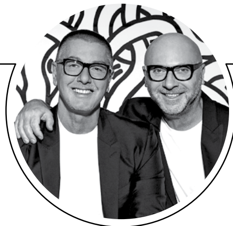
Stefano Gabbana e Domenico Dolce